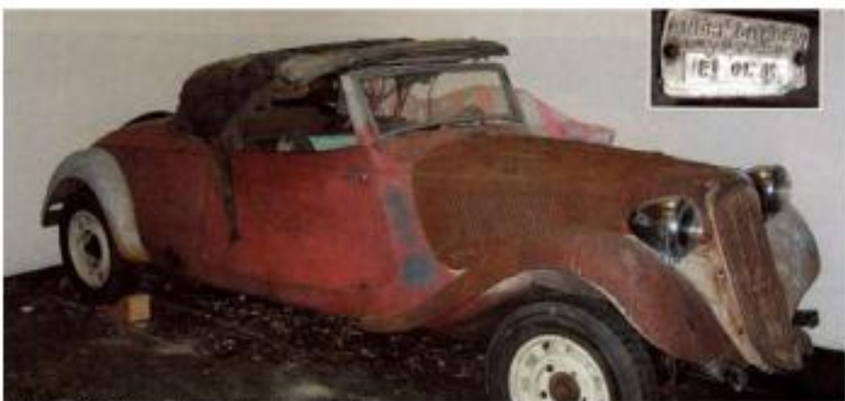
Roadster 11 CV che sta per riorgera a nuova vita Roadster 11 HP qui va être ressuscité à une vie nouvelle.