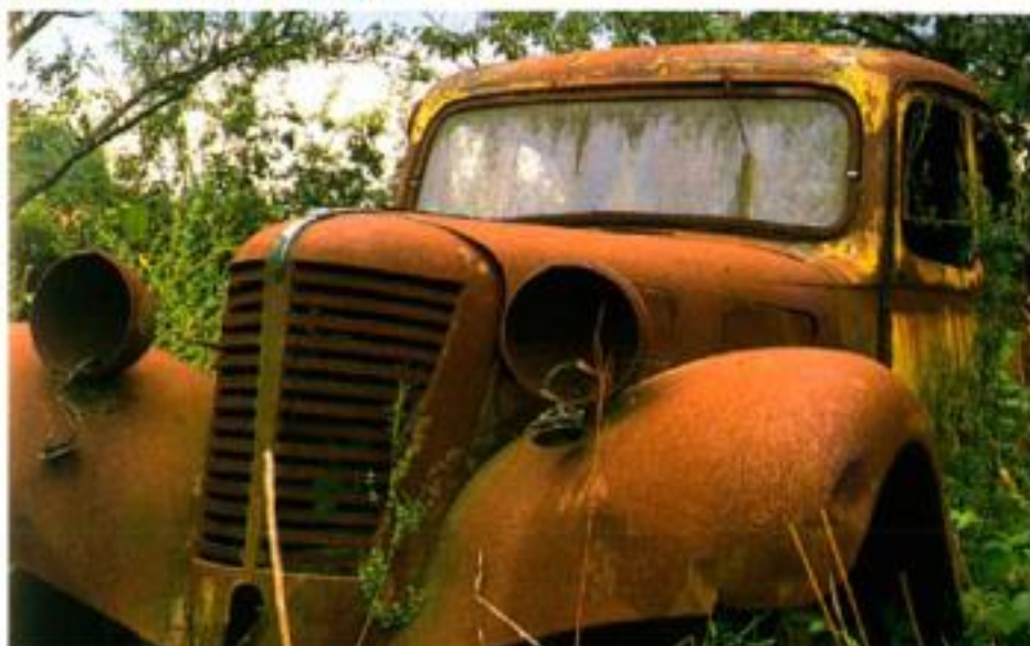
Una Traction con la Calandra "E.T." (Emile Tonnelne) Une Traction avec la Calandre "E.T." (Emile Tonnelne)

En Italie, en pleine campagne, les vieux greniers à grains et les granges chorégraphiques ont disparu depuis longtemps, engloutis par des hangars industriels, des pavillons géométriques (avec le soutien complice des géomètres), des resorts et des agritourismes élégants. Avec eux s'en est allé l'espoir de découvrir une vieille carcasse oubliée sous des tas de bois ou de foin : une Balilla, une Alfa 8C, une Ardea. En France, des explorations de ce genre ont continué plus longtemps et il était encore possible, jusqu'à la fin des années 80 et même plus tard, de faire quelques découvertes palpitantes. Ce recueil de pièces rares en témoigne ; elles sont toutes françaises et appartiennent presque toutes à la Traction Avant de plusieurs origines et modèles. Nous vous proposons ces pages palpitantes tirées d'un livre de Sabates publié il y a une dizaine d'années.