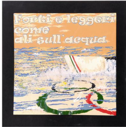
9° Classificato BAGGIO Nicolò, 5BSL con l'opera di seguito riprodotta