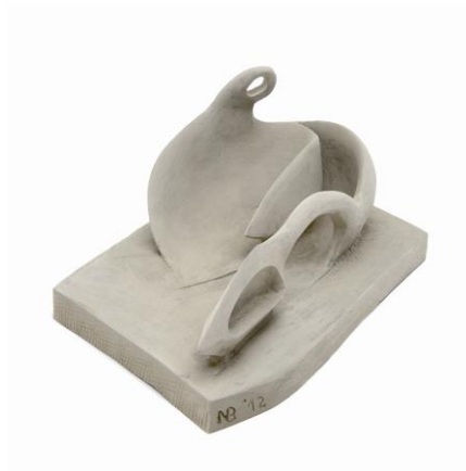
10° Classificato GOI Caterina, 3BSL con l'opera di seguito riprodotta